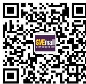
订阅号 推送市政府相关政策扶持信息