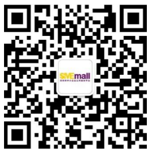
服务号 查询更多企业服务信息